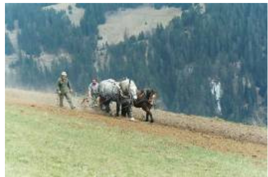
sieh mal einer an...