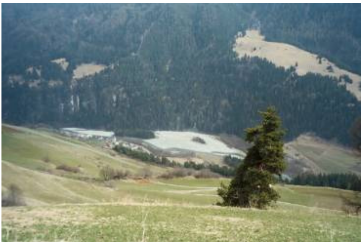
Stradaauen (zugegeben: noch von weit oben...)