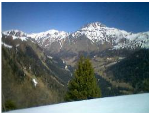
Blick ins Val Sinestra