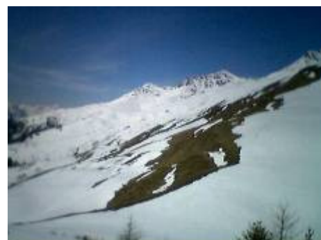
eben: es war noch früh im Frühling...