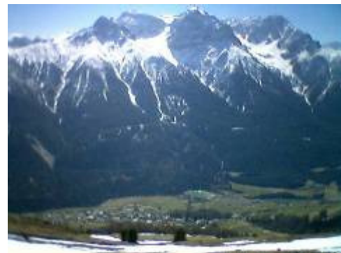
Blick hinab nach Scuol und zur Lischanagruppe