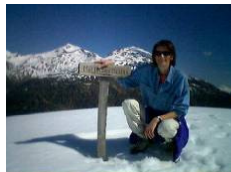
oben (früh im Frühling...)