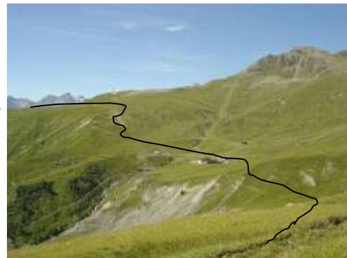
Blick zurück nach Jonvrai (Pfeil: Weg von Motta Naluns)