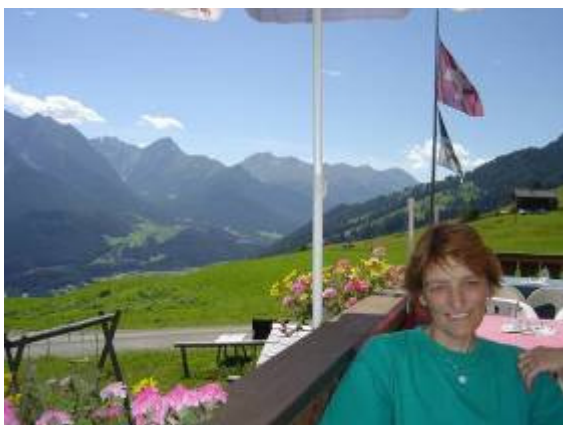
Zwischenhalt in Vastur...