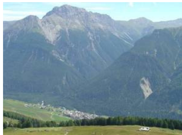
Blick über Muot San Peder hinab nach Sent