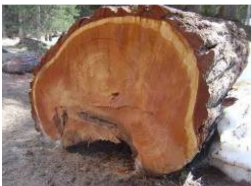
da liegst Du...