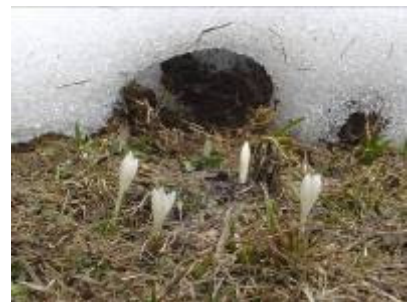
Frühling bei Flora...