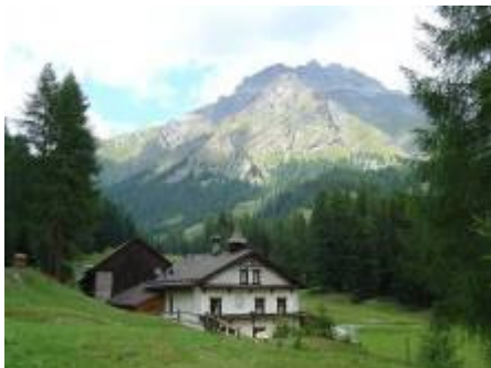
Hof Zuort und Hotel Val Sinestra