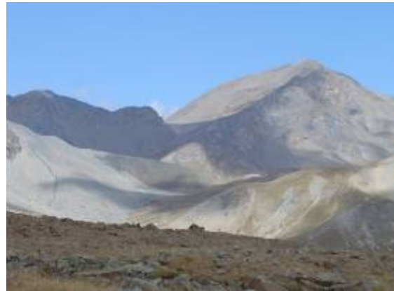
Blick hinüber zum Piz Davo Lais...