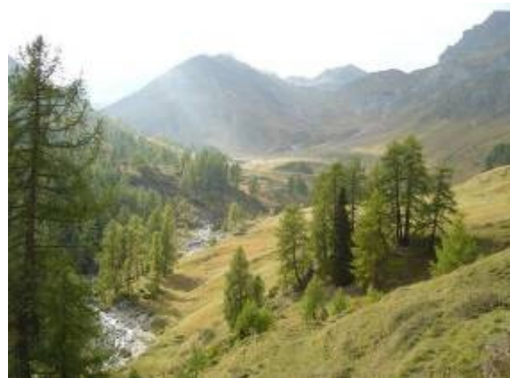
im Val Laver